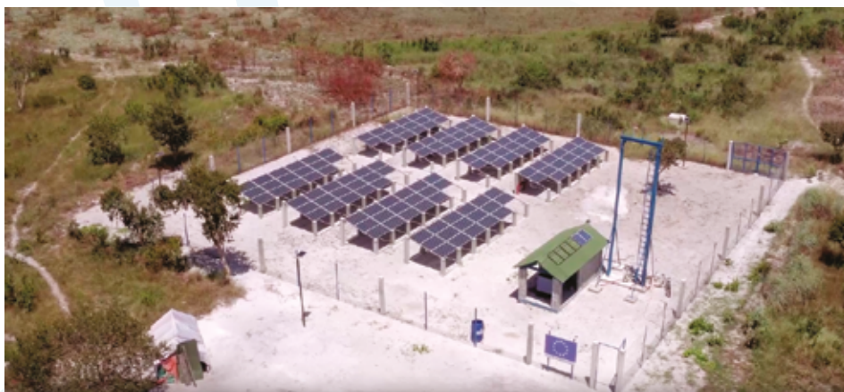
Champ solaire de 30 kWc mis en place dans le cadre d'un projet d'agroforesterie en République Démocratique du Congo.