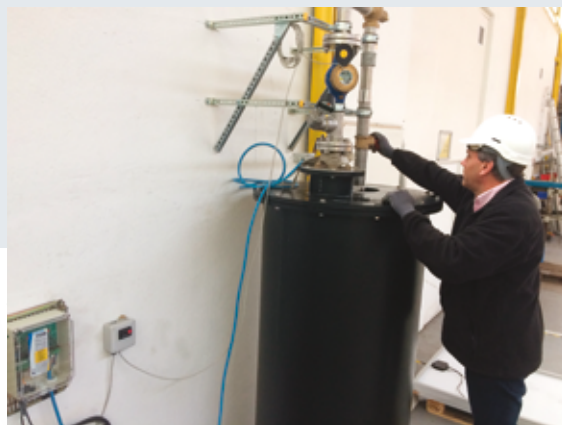
Banc de test permettant au bureau d'études d'évaluer les performances d'un modèle de pompe particulier selon les caractéristiques d'ensoleillement précises d'un site.